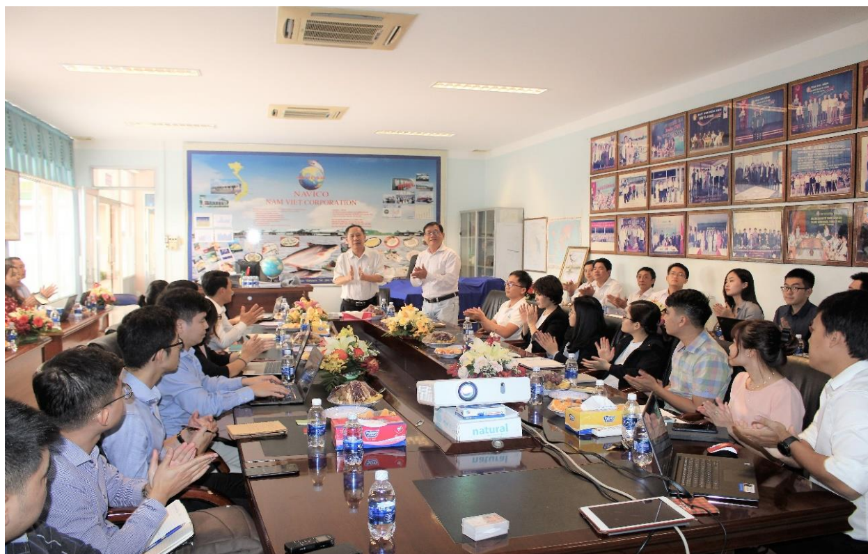
Họp Công ty chứng khoán và Quỹ đầu tư ngày 7/12/2018

Từ ngày 7/12 đến ngày 8/12, Nam Việt đã tổ chức thành công buổi họp mặt và tham quan công ty tại trụ sở chính của công ty ở tỉnh An Giang. Buổi họp đã thu hút hơn 30 chuyên viên phân tích từ các công ty chứng khoán và quỹ đầu tư. Tại cuộc họp, Chủ tịch Nam Việt đã chia sẻ về lịch sử hình thành và các kế hoạch trong tương lai của công ty. Ngoài ra chúng tôi cũng trình bày tình hình tài chính và tổ chức buổi tham quan các vùng nuôi của công ty.